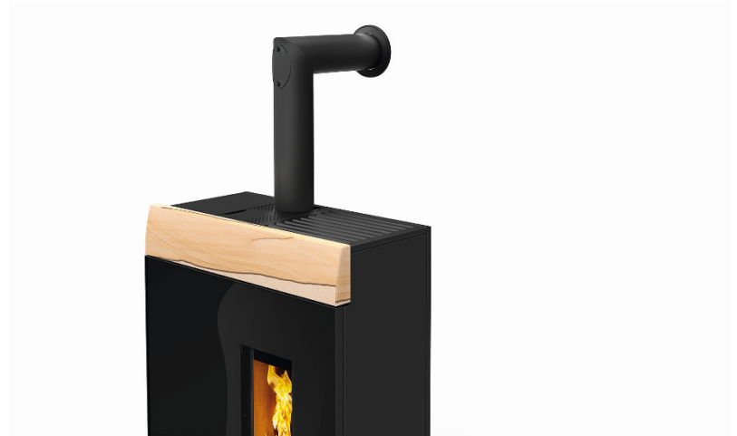
FÅS OGSÅ MED TOPAFGANG (ROCO RAO) MED PLADS TIL HELE 33 KG. TRÆPILLER